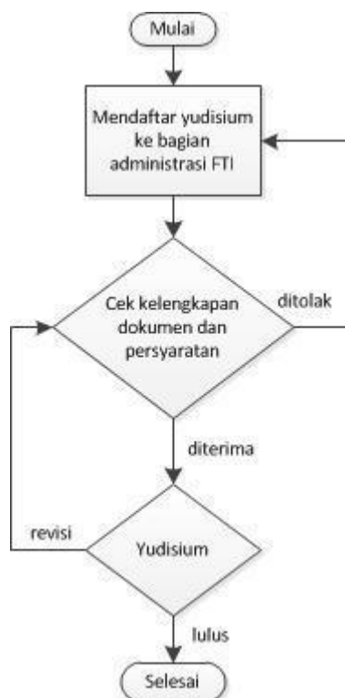
Gambar 3 Prosedur Yudisium

Gambar 3 adalah flowchart prosedur yudisium mulai dari pengajuan hingga selesai yudisium.